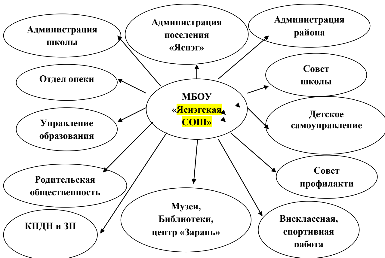
Схема сетевого взаимодействия с социальными партнерами в реализации программы формирования экологической культуры, здорового и безопасного образа жизни

Работа по сохранению и укреплению здоровья учащихся, формированию у них экологической культуры в рамках данной Программы строится на принципе взаимодействия всех участников образовательного процесса, а также активном сотрудничестве школы с различными социальными субъектами: